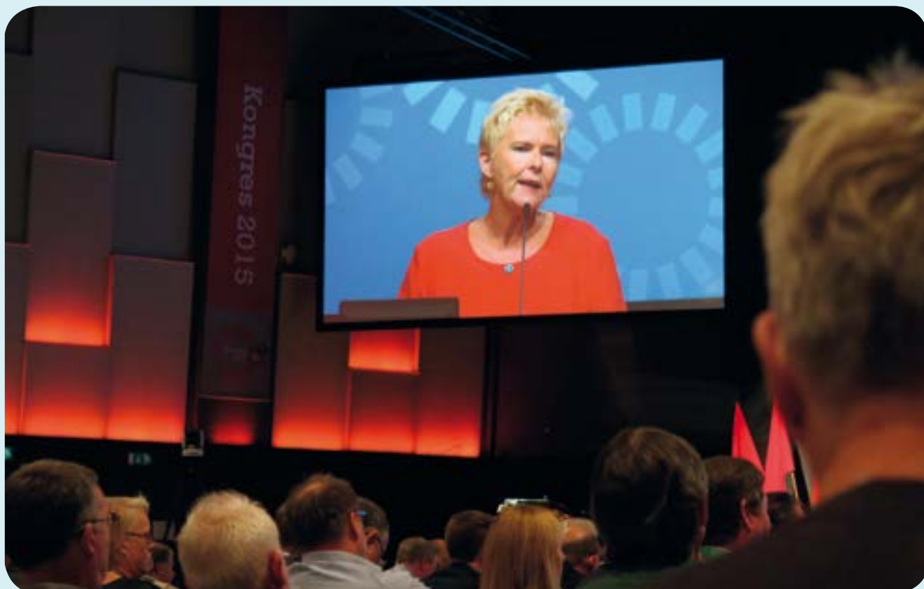
LOs nye formand, Lizette Risgaard, på talerstolen.

Jo, kongressen besluttede enstemmigt at arbejde videre med tankerne om at fusionere de to hovedorganisationer LO og FTF. Kongressen fastsatte også lønningerne til de kongresvalgte og udvidede antallet af kongresvalgte fra 4 til 5.