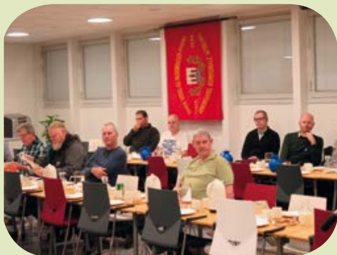
Der var få fremmødte til årets generalforsamling. Men vi vælger at tolke det som, at medlemmerne er tilfredse med repræsentantskabets måde at drive FOA 1 på.