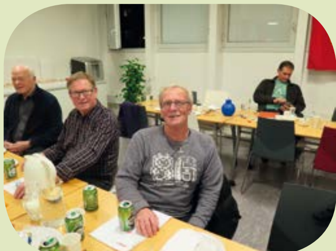
Nogle af FOAs seniorer.