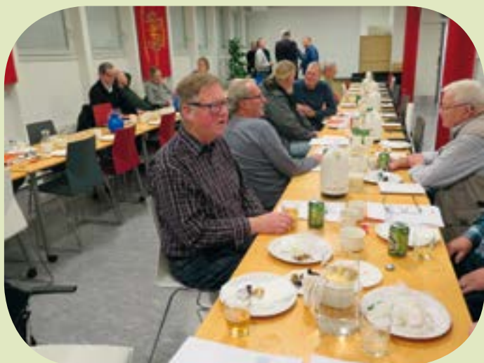
Der blev hygget og snakket i pausen.