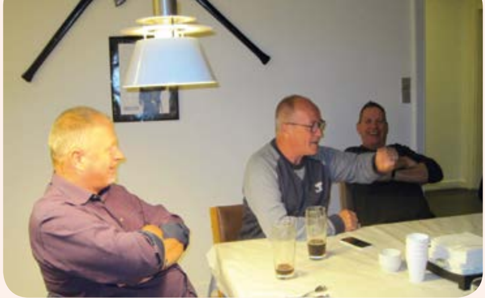
Til festen for de afgåede brandfolk blev der hygget og fortalt historier fra gamle dage.

Tirsdag den 6. oktober var der Seniorfest på Vesterbro Brandstation. Alle stationens afgåede brandfolk var inviteret. Og korpsånden lever stadig, gæsterne kom fra nær og fjern, og den ældste deltager var 81 år.