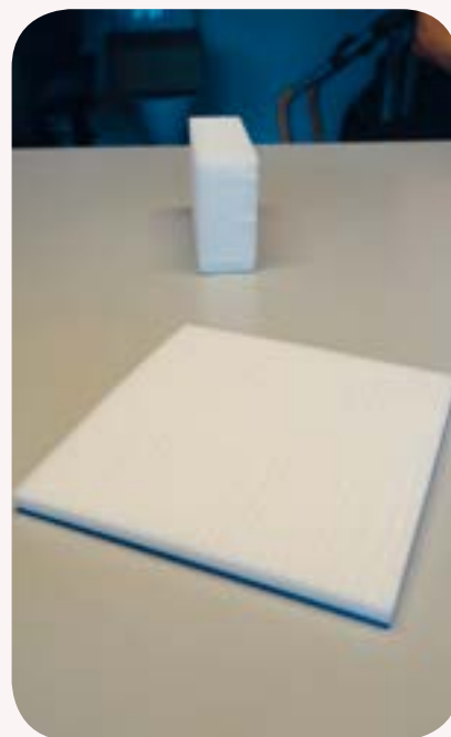
De 2 rengøringsvampe, forrest den nye svamp fra Scander, bagest det gamle viskelæder.