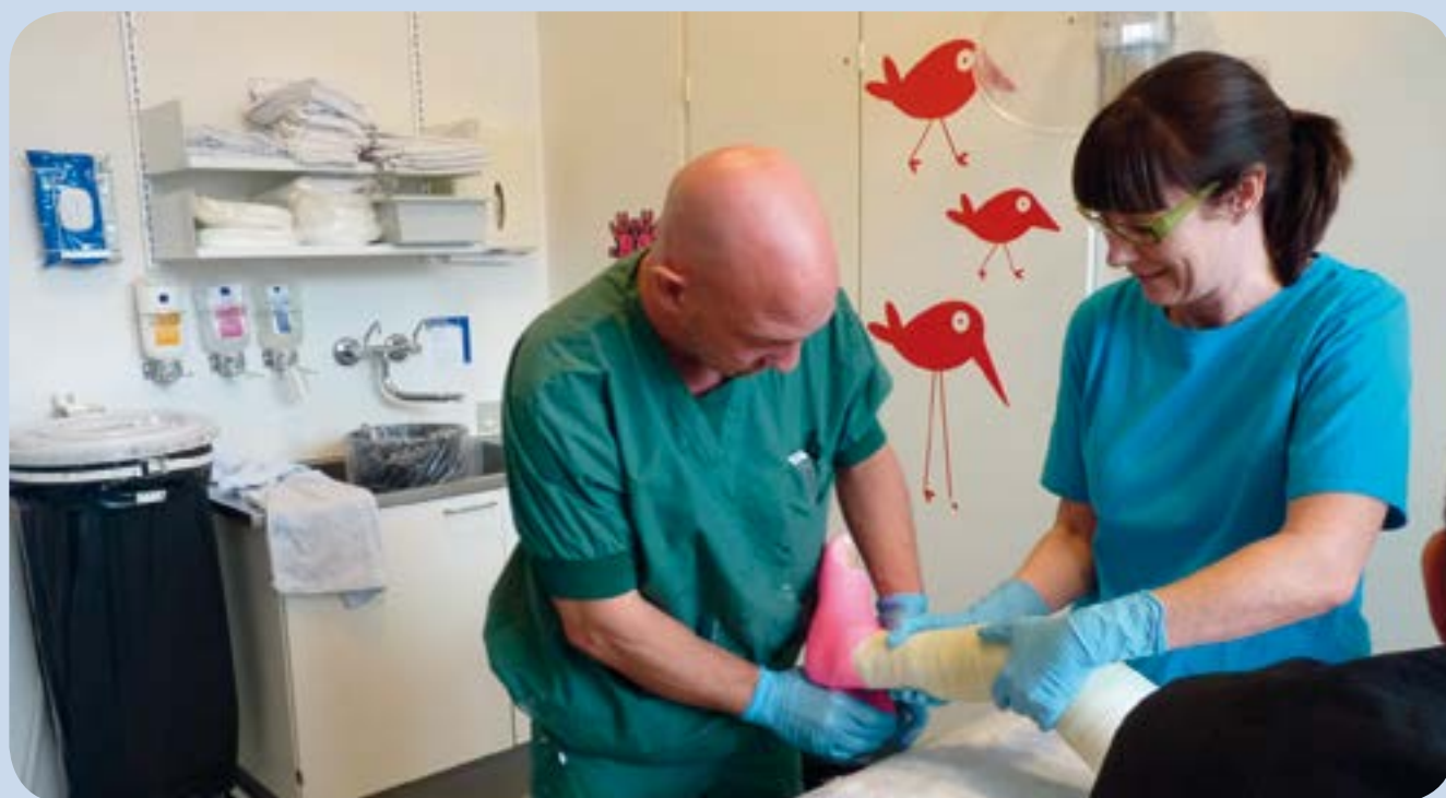
Her ses en af Rigshospitalets portører i gang med at lægge gips, som kræver den helt rette teknik.

Inden vi takker af og vender hjemad, får vi en tur rundt på Rigshospitalet, så vi kan se nogle af de steder, hvor portørerne har deres daglige gang. Således afsluttes dagen på helikopterplatformen på toppen af Rigshospitalet med udsigt over hele København.