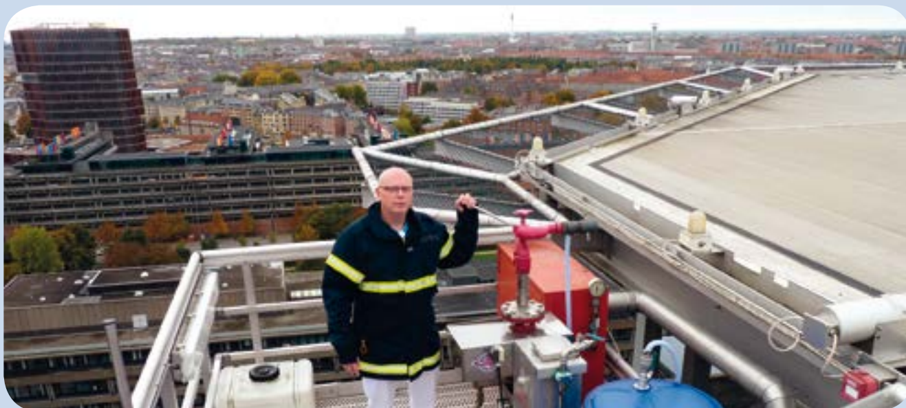
Portører, der er ansat i HovedOrtoCentret, har blandt andet ansvaret for patienter, der ankommer til helikopterplatformen på toppen af Rigshospitalet. Her er der uddannet 12 helikopterportører, som modtager bl.a. traumepatienter.