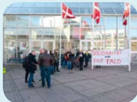
Uden for kongres-bygningen blev der demonstreret mod dagpengeforliget.