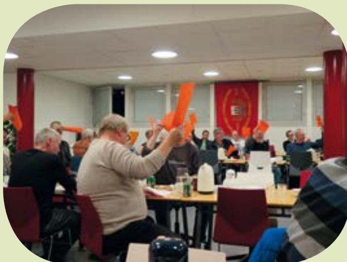
Så er der afstemning.

Da der stadig var sandwich tilovers, valgte formanden at køre forbi Mændenes Hjem med dem for at glæde dem, der var der den aften.