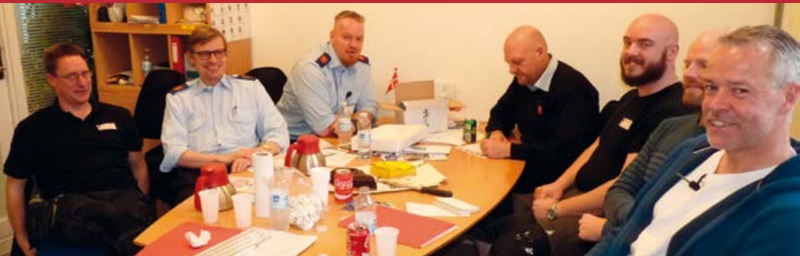
På Rådhuset i Glostrup blev der snakket om fordele ved at have en faglig klub.