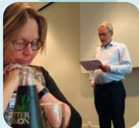
FOAs delegation drøftede dagens program om morgenen, inden kongressen startede.